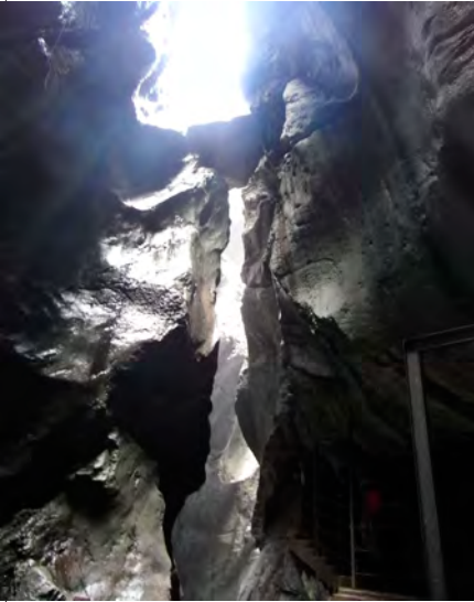
Der Rosenlauibach hat im Lauf der Jahrtausende eine eindrückliche Gletscherschlucht gegraben

Sie übernehmen am Vormittag bei Argovia Classics in Brugg Ihr Auto und machen sich auf den Weg zum Grimselpass. Dabei folgen Sie in lieblicher Landschaft dem Fluss Reuss, vor Ihren Augen (fast) immer die mächtigen Gipfel der Alpen. Sie umfahren Luzern auf der Autobahn und folgen dem reizvollen Sarnersee. Er liegt eingebettet wie eine schimmernde Perle zwischen den Bergen. Am gut ausgebauten, aber steilen und kurvigen Brünigpass sammeln Sie erste Erfahrungen mit Ihrem Klassiker am Berg. Auf der anderen Seite der Passhöhe gehts hinunter ins Berner Oberland. Wir empfehlen Ihnen einen Abstecher nach Brienz, wo Sie direkt am See in einem der gemütlichen Restaurants Ihre Mittagspause einlegen können. Nachher fahren Sie nach Meiringen und von dort Richtung Innertkirchen. Unterwegs können Sie die höchst eindrückliche Rosenlauischlucht mit ihren steilen Felswänden durchwandern (ca. 1.5 Stunden) oder die 120 m hohen Reichenbachfälle bewundern, wo einst Sherlock Holmes im Kampf abgestürzt war. In Innertkirchen nehmen Sie die Strecke zum Grimselpass unter die Räder und treffen nach kurzer Zeit in Ihrem Hotel ein.