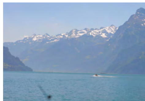
Der Vierwaldstättersee: Geschichtsträchtig und früher eine wichtige Verkehrsachse

Grimsel- und Furkapass kennen Sie vielleicht schon: 2 grossartige, hochalpine Pässe, wo Sie auch im Hochsommer oft zwischen meterhohen Schneewänden fahren. Der Furkapass führt Sie nach Andermatt und hoch über der Schöllenen Schlucht nach Göschenen. Sie folgen der gut ausgebauten Gotthardstrasse bis nach Altdorf. Weiter führt der Weg entlang des fjord-ähnlichen Vierwaldstättersees in vielen Kurven auf der historischen "Axenstrasse" nach Brunnen, wo sogar Palmen wachsen. Von dort sind Sie in rund einer Stunde am Ziel, in Brugg. Wenn Sie Lust haben, können Sie von Brunnen aus auch noch Luzern oder Zug besuchen.