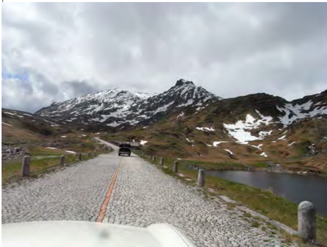
Nostalgische Fahrt auf der alten, kopfsteinbepflasterten Gotthardstrasse zur Passhöhe des Gotthards

Dies ist die Königsetappe der "Argovia Classics Grimsselfahrt". Sie überqueren 5x einen Pass und fahren dabei auch in das Tessin und in das Wallis. Wie bei Tour 2 überqueren Sie zuerst den Grimselpass. In Gletsch wenden Sie sich nach links und fahren über den Furkapass, vorbei am immer noch mächtigen Rhonegletscher.