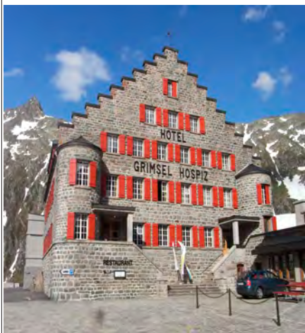
Fantastische Ausblicke auf Grimsel- und Oberaarsee: Hotel Grimsel Hospiz

Im Herzen der Hochalpen gelegen, ist der Grimselpass von berühmten anderen Alpenübergängen und Reisewegen umgeben: St. Gotthardpass, Furkapass, Nufenenpass, Sustenpass. Oldtimerfahrer finden hier das ultimative Fahrvergnügen!