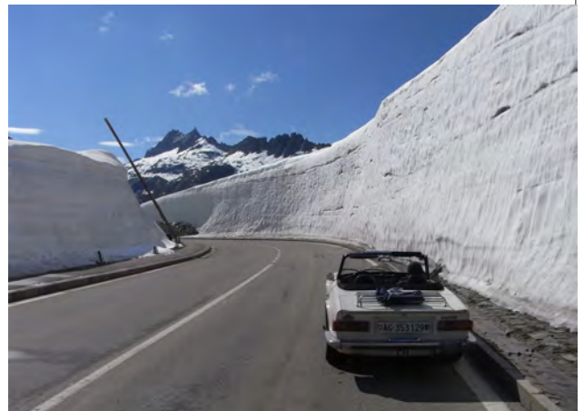
Die Grimsel-Passhöhe im Sommer: Möglicherweise säumen immer noch hohe Schneemauern die Strasse

Die Tour führt zuerst über den Grimselpass. Teilweise können Sie die alte Strasse mit ihrem Kopfsteinplaster benutzen. Sie fahren vorbei an den mächtigen Stauseen, welche der Produktion von Strom dienen und europäische Bedeutung haben. Sie sind in die Natur eingepasst, wie wenn sie schon immer dahin gehörten. Auf hochalpinen Strecke überfahren Sie den Alpenkamm. Die Wahrscheinlichkeit, dass Sie auch noch im Sommer zwischen meterhohen Schneewänden fahren, ist hoch. Nach kurzer, steiler Abfahrt sind Sie in Gletsch auf der Alpensüdseite. Sie wenden sich nach rechts und fahren durch das liebe Goms, einem Hochtal mit schmucken Dörfern, nach Brig. Brig war und ist nicht nur ein wichtiger Eisenbahnknotenpunkt sondern seit jeher Schnittpunkt der Verkehrs- und Handelsachsen von West nach Ost und über den Simplon nach Süden. Der Besuch der Stadt lohnt sich. Sie fahren den gleichen Weg zurück, aber keine Angst - es gibt immer wieder neue Einblicke in diese wunderbare Bergwelt!