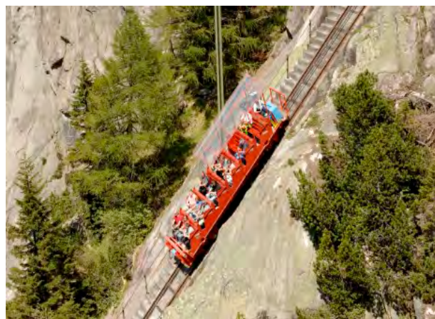
Die Gelmerbahn fährt fast senkrecht den Berg hoch

Auf dieser Tour fahren Sie nicht sehr weit. In der Nähe des Hotels Handeck lassen Sie das Auto stehen und besteigen die Gelmerbahn (Fr. 25.-/Person). Sie ist die steilste Standseilbahn Europas. Fast senkrecht fährt die Bahn, sie wurde ursprünglich als Transportbahn für den Kraftwerksbau gebaut, zum kleinen, verträumten Gelmersee. Eine Oase der Ruhe, umgeben von mächtigen Bergen und Gipfeln. Wer gerne wandert, kann den Rückweg unter die eigenen Füsse nehmen. Aber Sie können auch die Bahn zurück benutzen. Die Wanderung dauert rund 1.5 Stunden, der Weg ist leicht zu gehen, gutes Schuhwerk ist aber obligatorisch! Die Besichtigung der unterirdischen Welt der Kraftwerke lohnt sich auch für Menschen ohne technisches Flair. Es ist erstaunlich, was der Mensch da geschaffen hat!